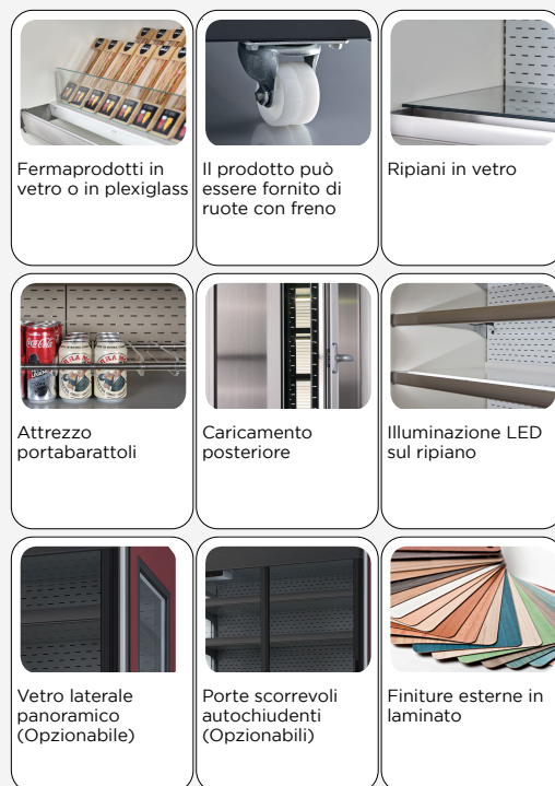
Fermaprodotti in vetro o in plexiglass